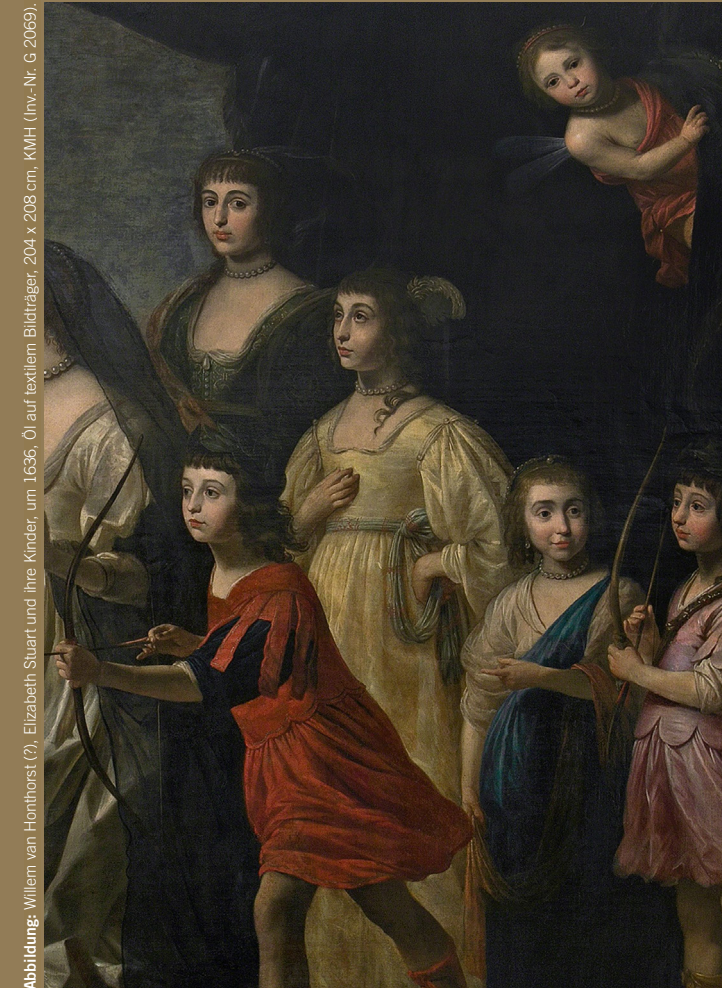
Abbildung: Willem van Honthorst (?), Elizabeth Stuart und ihre Kinder, um 1636. Öl auf textiliem Bildträger, 204 x 208 cm, KMH (inv.-Nr. G 2069).

Kurpfälzisches Museum Heidelberg, 6.–7. Februar 2020