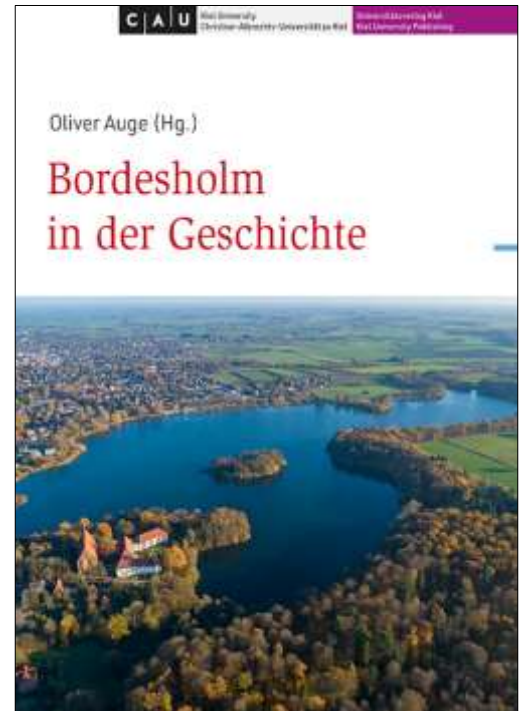
Buchcover der Chronik