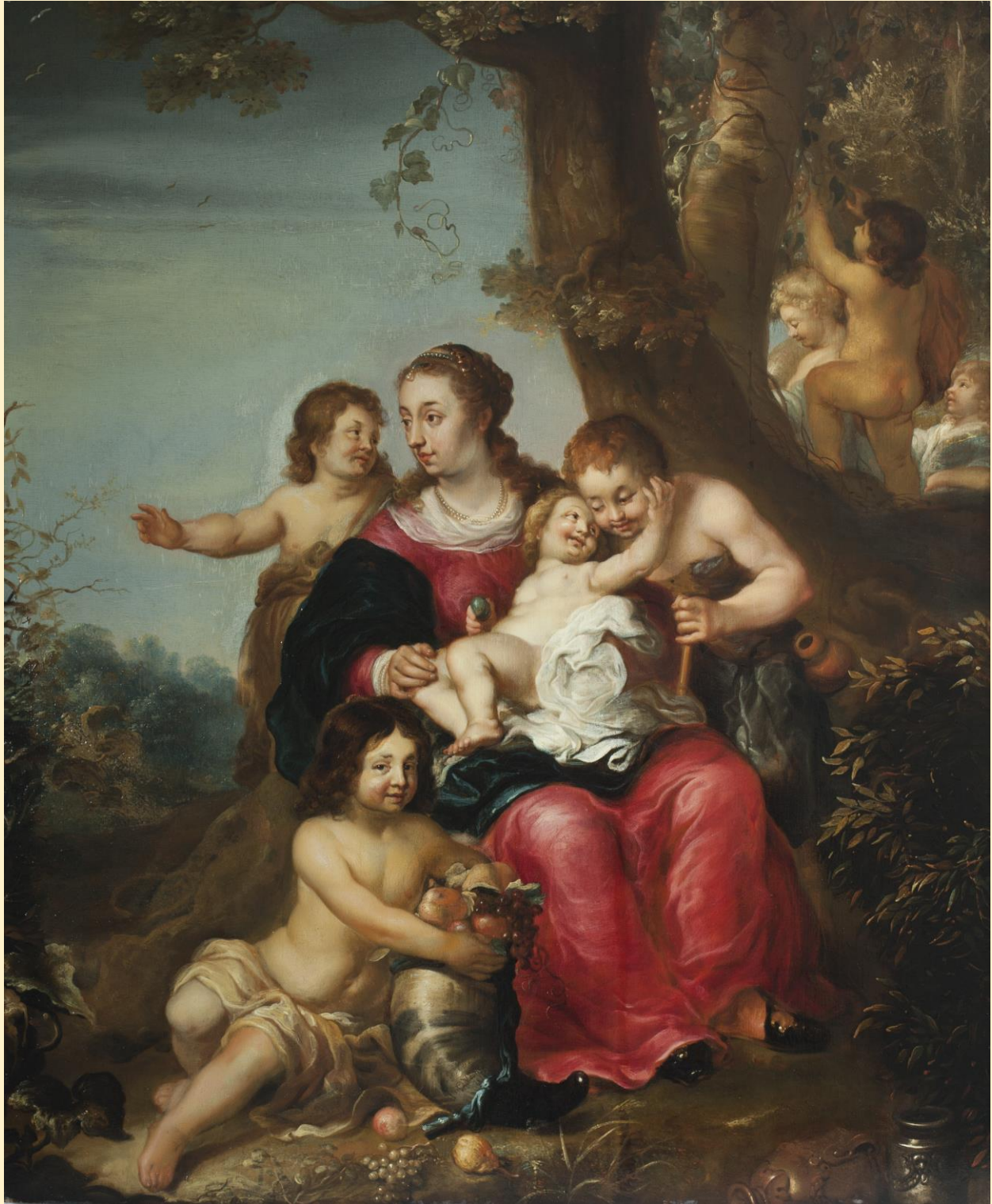
Jürgen Ovens, Maria Elisabeth von Sachsen mit ihren Söhnen, 1646, Öl auf Eichenholz, 82 x 67,4 cm, Inv.-Nr. 1986/2067.