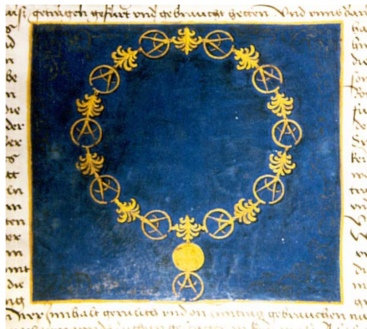
Abbildung 2 Die Kette der Zirkel-Gesellschaft auf dem kaiserlichen Privileg

1486 unternahm die Zirkel-Gesellschaft einen weiteren Schritt, um ihre Vormachtstellung zu festigen: Sie bewirkte die Ausstellung eines Privilegs durch Kaiser Friedrich III. In der Urkunde wird bestätigt, daß die gesellschaft der heiligen Trivalentieit zu Lübecke, die man nennet die zirkelbruder ihr Gesellschaftszeichen immer und überall tragen durfte. Das Zeichen wurde in der Urkunde genau beschrieben und um jede Unsicherheit zu umgehen, wurde es auch noch in deren Mitte gemalt (Abbildung 2). Mit diesem Privileg wurde nun die Zirkel-Gesellschaft von der höchsten Instanz des Reiches – dem Kaiser – anerkannt, womit sich das Prestige der Gesellschaft und somit auch deren Mitglieder erhöht, und damit ihr Vorrang innerhalb der Lübecker Sozialhierarchie zusätzlich unterstrichen wurde. Das Gesellschaftszeichen wird mit der kaiserlichen Privilegierung nun noch mehr zum Rangsymbol, das der Öffentlichkeit den hohen Rang des Trägers vor Augen führte.